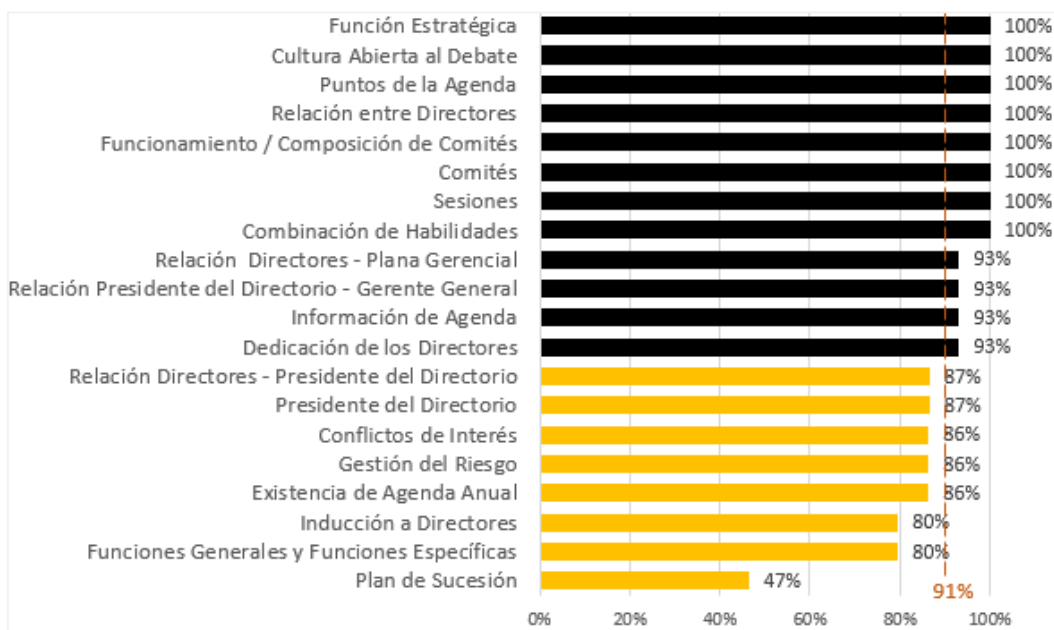
Gráfico Nº 2: Evaluación del Directorio - Resultados por elemento 1